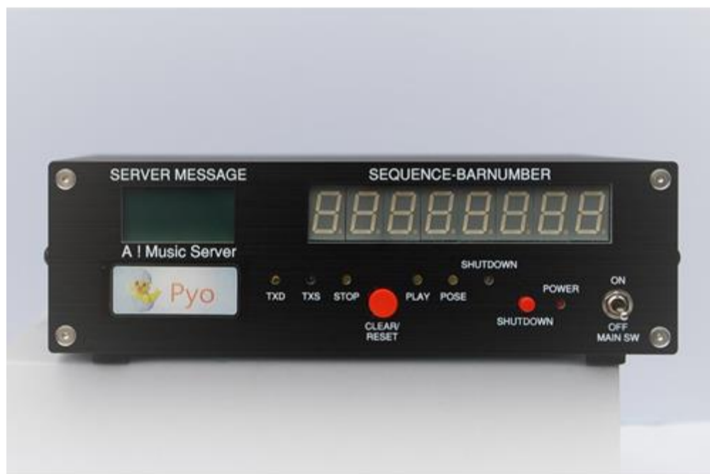
サーバーの表パネル