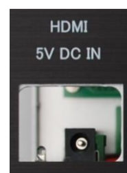
5V DC IN

5VDC IN のDCプラグに付属のACアダプターを接続します。(MAINスイッチはOFFにしておいてください。)