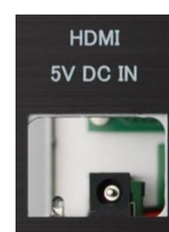
5V DC IN

5VDC IN のDCプラグに付属のACアダプターを接続します。(MAINスイッチはOFFにしておいてください。)